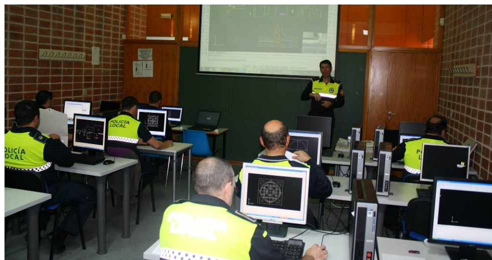
D08/13 – Diseño de croquis en accidentes de tráfico urbano