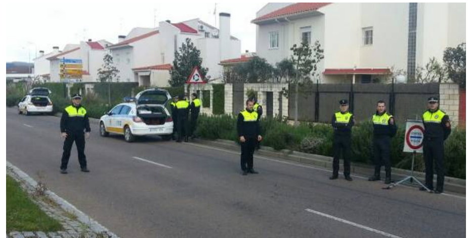
B08/13 – Equipos Técnicos de Medida