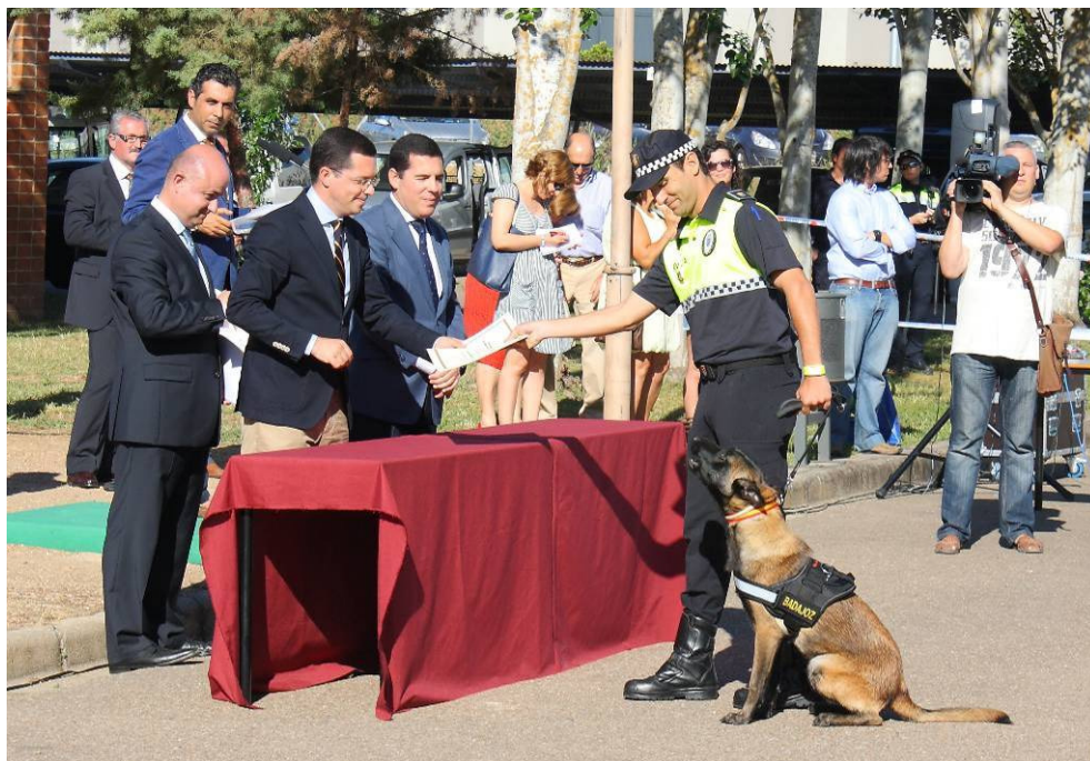
Entrega de diplomas a instructores y alumnos el día de la clausura, por parte del Sr. Consejero de Admón Pública, del Sr. Director General de Admón Local, Justicia e Interior y del Sr. Jefe de Servicio de la ASPEX