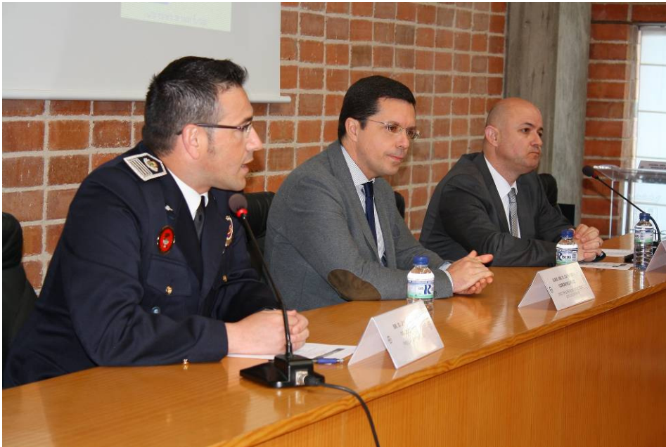
Presentación de las Jornadas por parte del Director General, Presidente de AJEPLOEX y Jefe de Servicio de la ASPEX