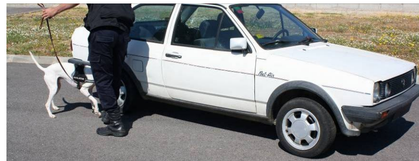
Alumno practicando la detección de sustancias estupefacientes con su perro