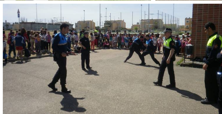
Escolares durante las distintas actividades que se realizaron