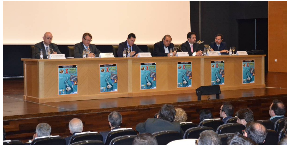
Presentación de las Jornadas por parte del Consejero de Admón. Pública y del Consejero de Fomento, Vivienda Ordenación del Territorio y Turismo.