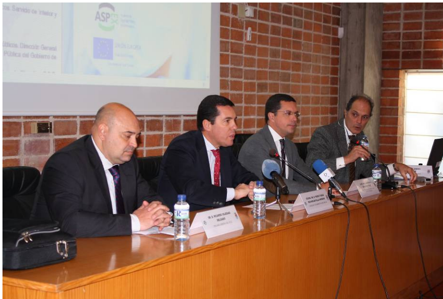
Presentación por parte del Consejero y del Director General