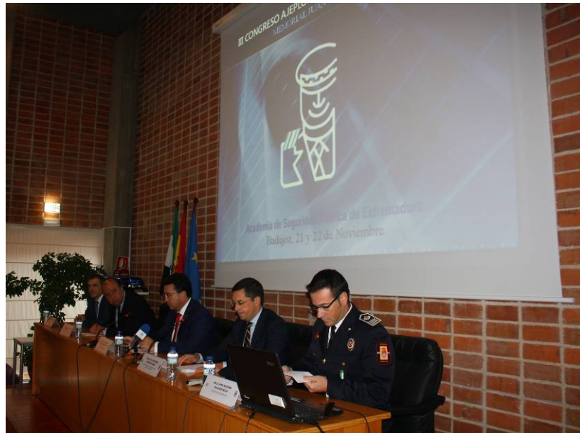
Presentación de las Jornadas por parte del Presidente de la Asamblea de Extremadura, Delegado del Gobierno, Primer Teniente Alcalde del Ayto de Badajoz, Director General y Presidente de AJEPLOEX