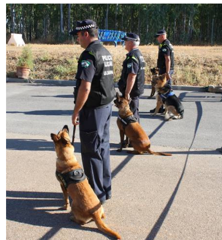
Alumnos con sus perros en un momento de la clausura