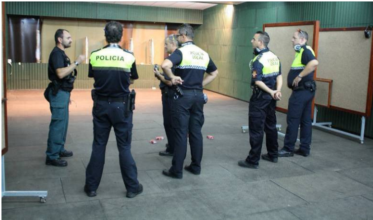
B02/13 – Perfeccionamiento para Monitores de Tiro