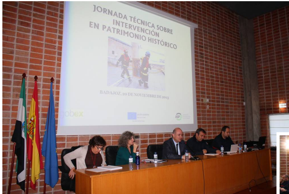
Presentación de la Jornada por parte del Jefe de Servicio de la ASPEX