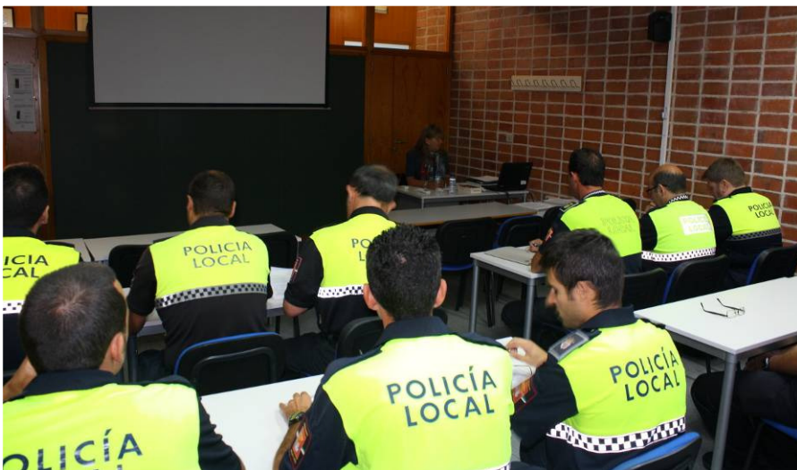
B04/13 – Capacitación de Agente Tutor