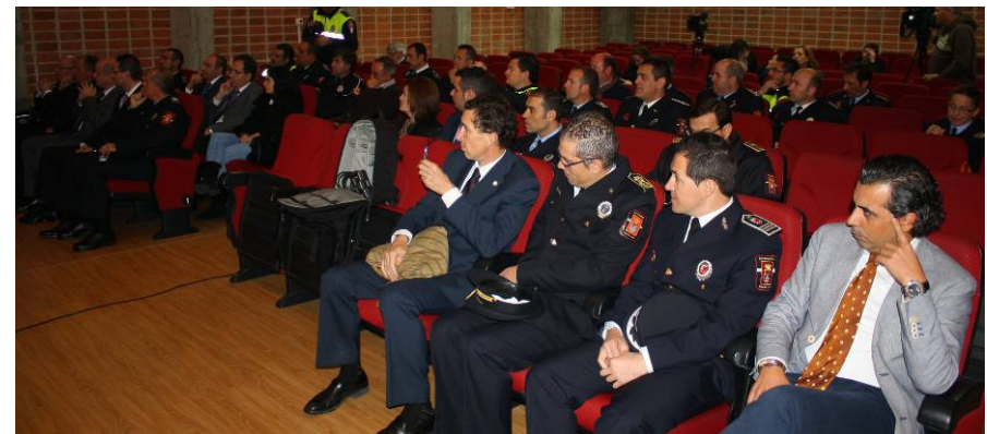
Algunos de los asistentes