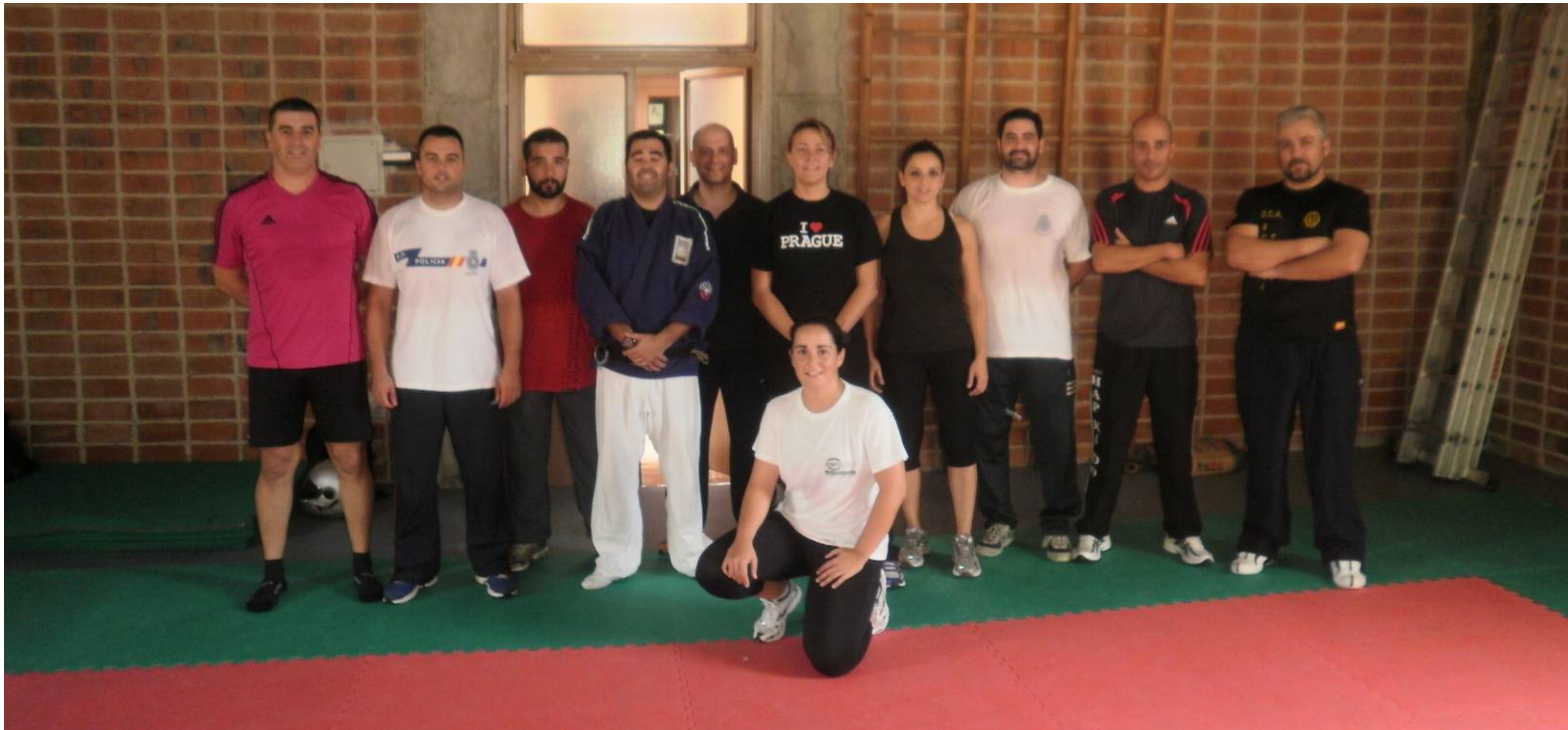
Algunos de los alumnos participantes en el Aula de DPP