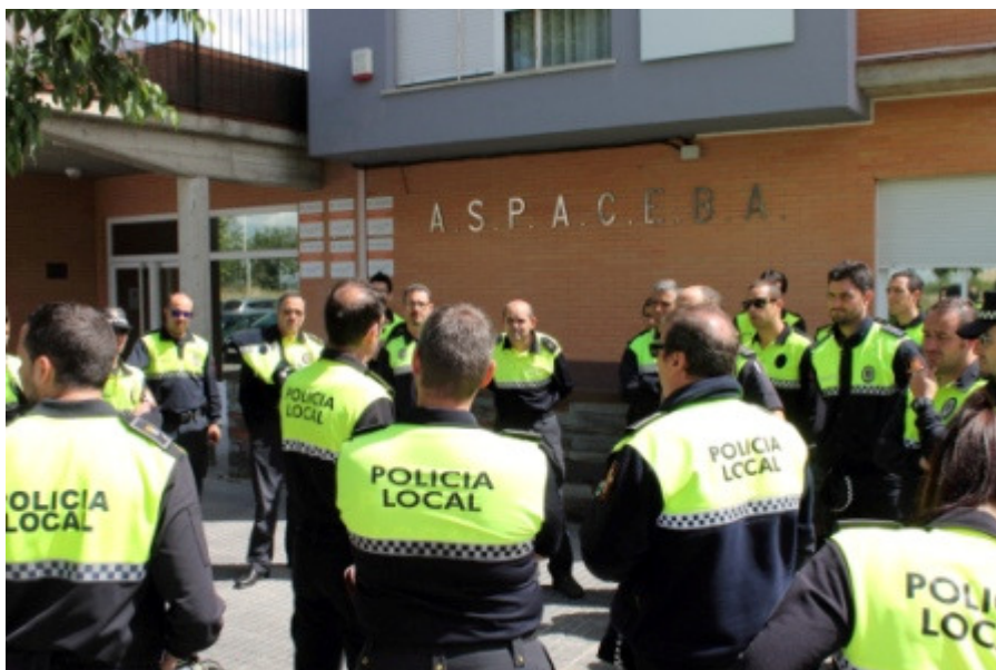
D01/13 – Monitor de Educación Vial. Nivel II