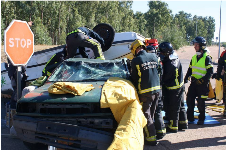
E01/13 - Intervención en accidentes de tráfico