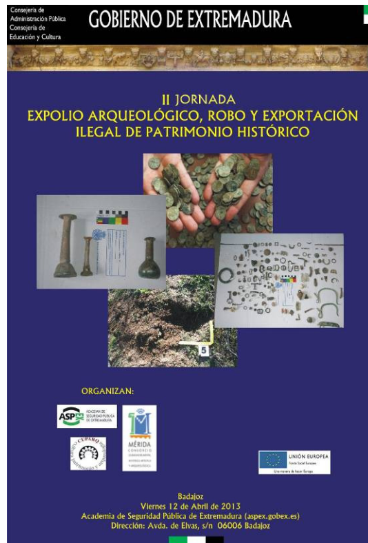
Cartel de la Jornada