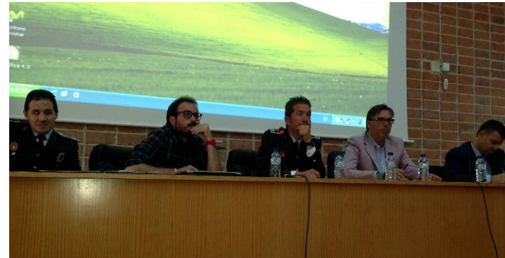
Algunos de los ponentes