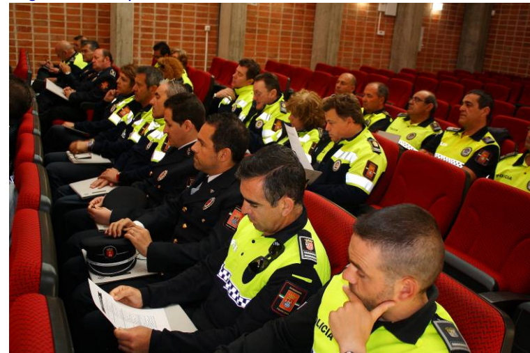
Algunos de los asistentes