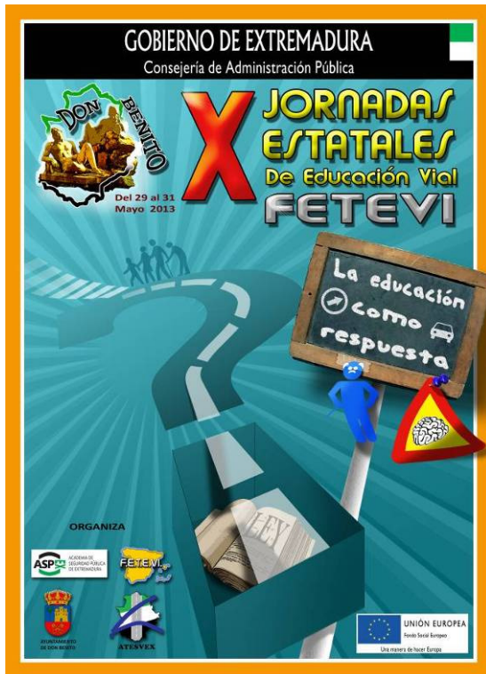
Cartel de las Jornadas