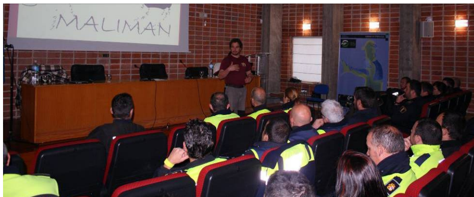
Alumnos en el Salón de Actos en la parte teórica del curso