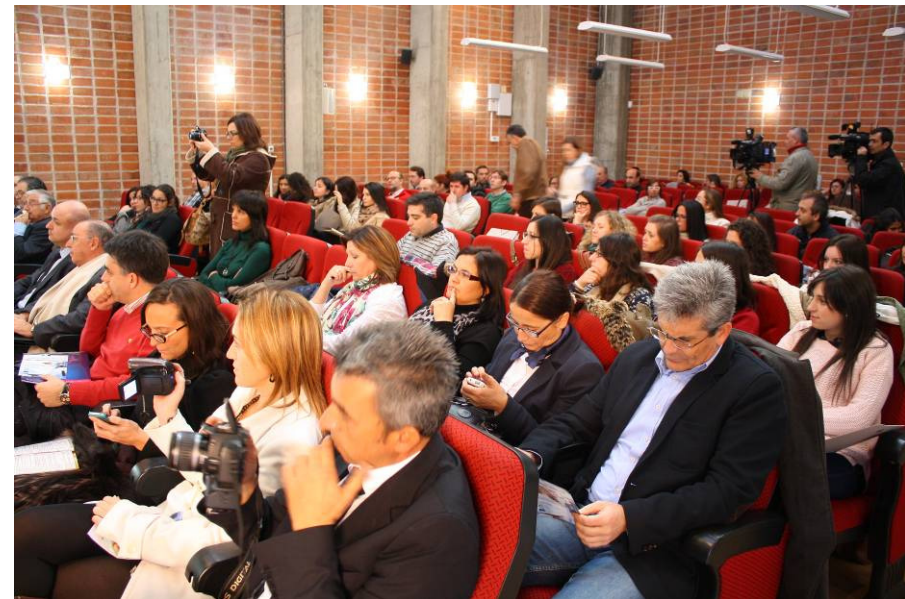
Algunos de los asistentes