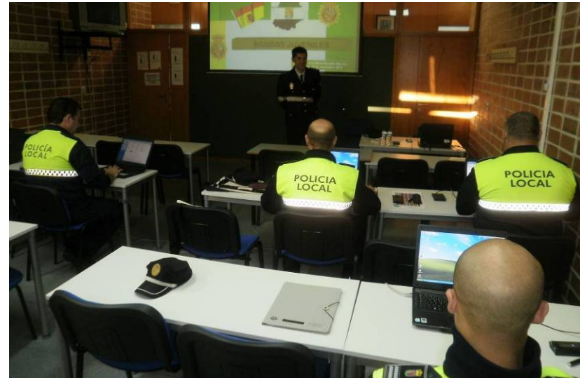
Alumnos durante una sesión en el aula