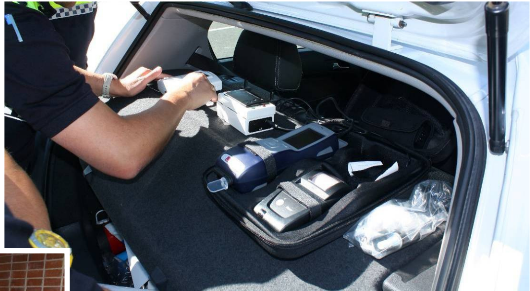
B06/13 – Detección de Drogas en Conductores