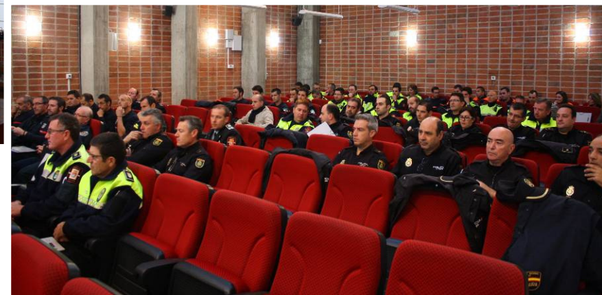
Algunos de los asistentes