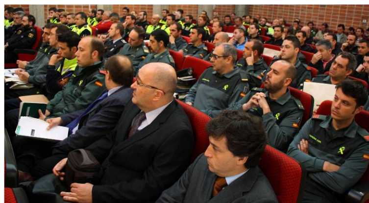
Algunos de los participantes