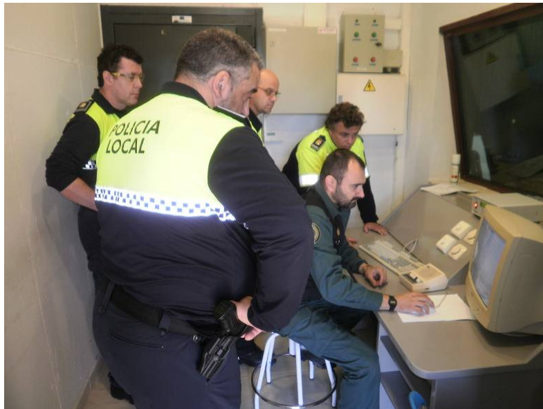
Alumnos durante una sesión práctica en la galería de tiro