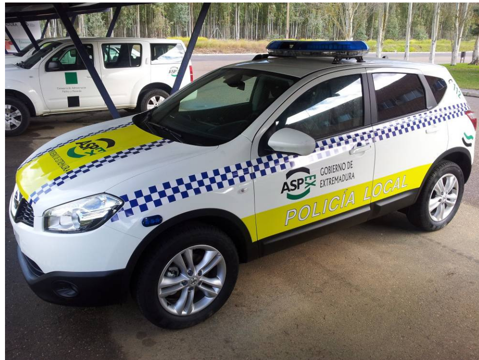
Vehículo con equipamiento policial