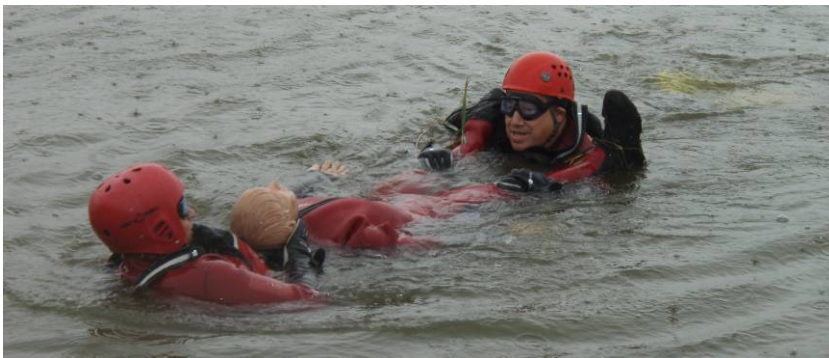
E02/13 - Curso básico de seguridad en búsqueda y rescate en inundaciones y riadas