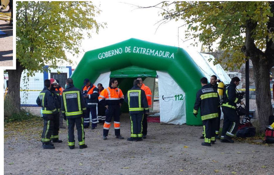
E03/13 – Intervención en Patrimonio Histórico