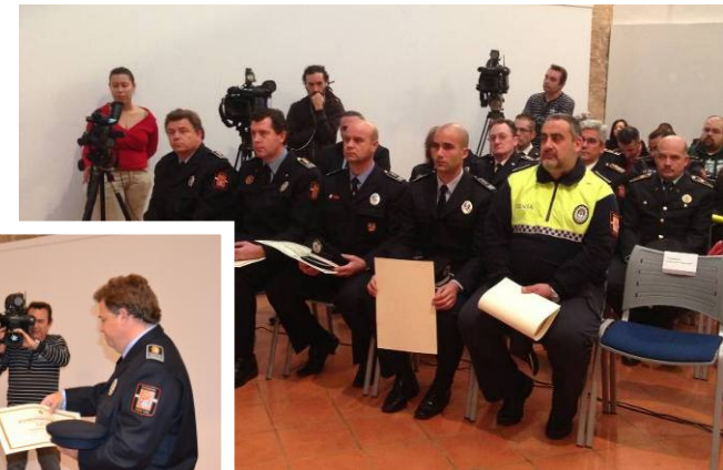
Alumnos durante la Clausura