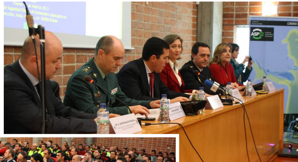
Presentación por parte del Consejero