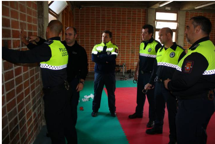
Alumnos durante una sesión práctica en el gimnasio