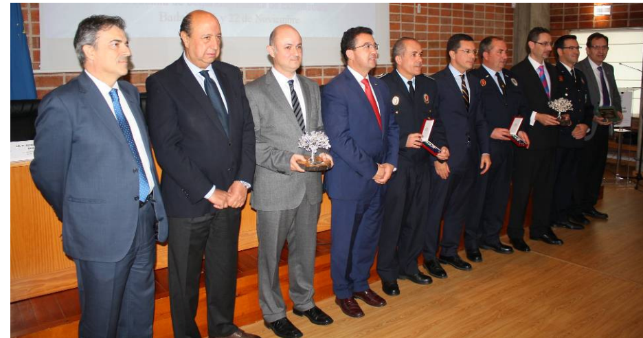
Momento de la entrega de los Reconocimientos